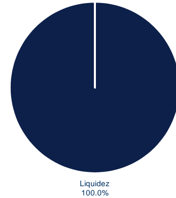
Composición de la cartera por tipo de tasa